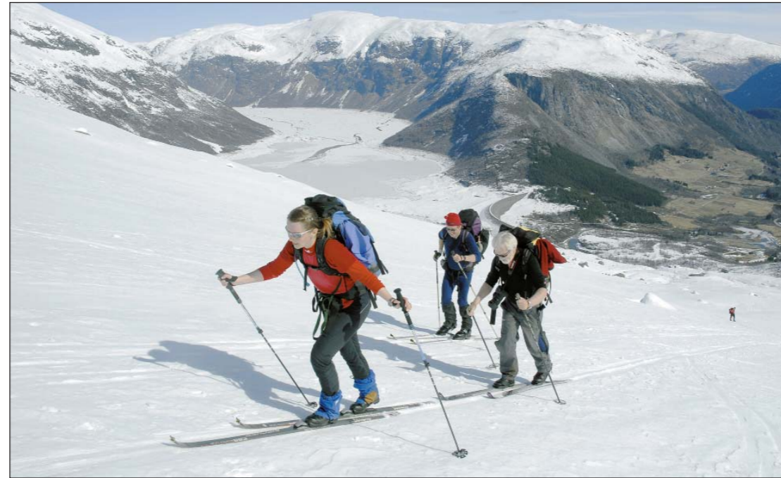
OPP FRÅ VÅREN: På veg opp mot Nonskard frå Leirdalen. Tunsbergdalsvatnet og vårgroene markar i Leirdalen i bakgrunnen.