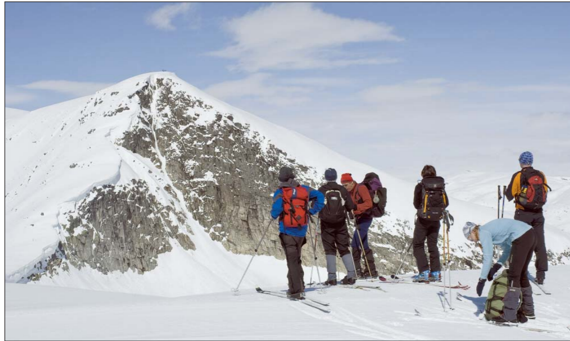
MOTTOPPEN: På siste kulen før toppen hadde me god utsikt til Hest, men toppen viste seg for utfordrande for turlagsfølget då fast og skarete snø gav fare for utgliding.