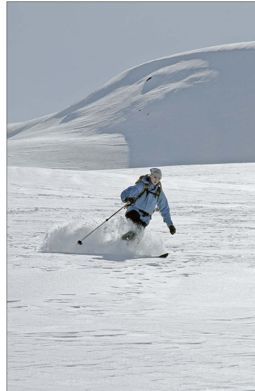
MAIPUDDER: Det var høve til å få til fine telemarksvingar der vindtransportert puddersnø dekte skaren.